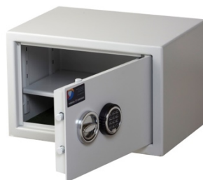
Sikringsskab SAK Mini Spartan Pivot elektronisk kodelås

Vi anbefaler, at vi udfærdiger en installationserklæring til dig af hensyn til forsikringskrav og kvalitetssikring.