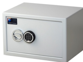
Sikringsskab SAK Mini Spartan Pivot elektronisk kodelås

Skabene er i fysisk identiske, men SAK Power giver endvidere mulighed for opladning til hardwaren, da der er tilsluttet strømforsyning.