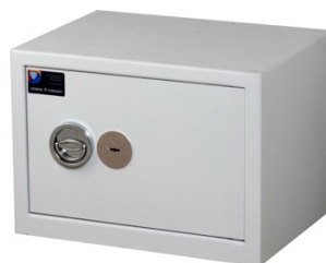
Sikringsskab SAK-E Mini Spartan Pivot elektronisk kodelås

Sikringsskabet SAK-E findes også som SAK-E Power. Skabene er i fysisk identiske, men SAK-E Power giver endvidere mulighed for opladning til hardwaren, da der er tilsluttet strømforsyning.