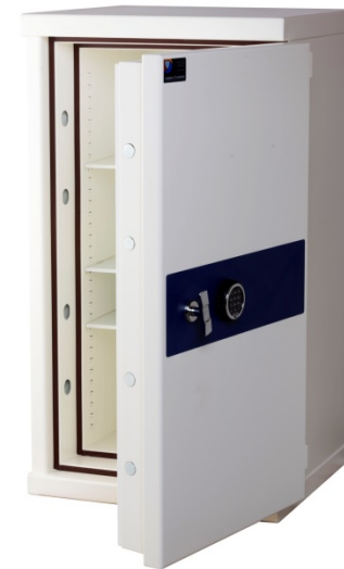
Euro H Plus 105 Titan D-Drive elektronisk kodelås