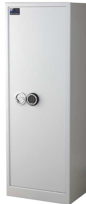
Sikringsskab SAK Maxi Spartan Pivot elektronisk kodelås