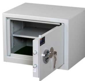
Sikringsskab SAK-E Mini Spartan Pivot elektronisk kodelås

Vi er ISO certificeret inden for "Projektering, installation, service samt vedligeholdelse af mekanisk sikring" og alle vores transportører, montører og serviceteknikere er uddannede og certificerede i sikringsteknik. Vi anbefaler, at vi udfærdiger en installationserklæring til dig af hensyn til forsikringskrav og kvalitetssikring.