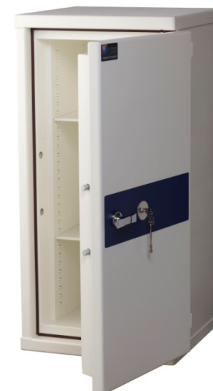
MiniRed H 100