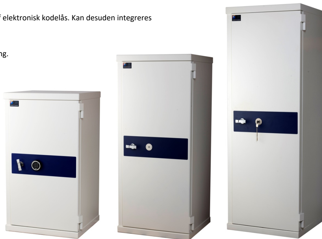
Euro H Plus 105 Titan D-Drive elektronisk kodelås

Som standard leveres skabe med en omstilbar nøgletås (to nøgler medfølger). Ønsker du dobbeltaflåsningen, så er Euro H0, H1, H2 og H3 Plus et rigtig god valg, da de er forberedt til dobbeltaflåsning (kontrollås), som sikrer, at der skal eksempelvis to forskellige nøgler eller to kodelåse til at åbne skabet. Skabene kan mod merpris også leveres med flere nøgler eller elektronisk(e) kodelås(e).