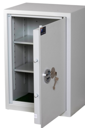
Sikringsskab SAK-E Medi Spartan Pivot elektronisk kodelås