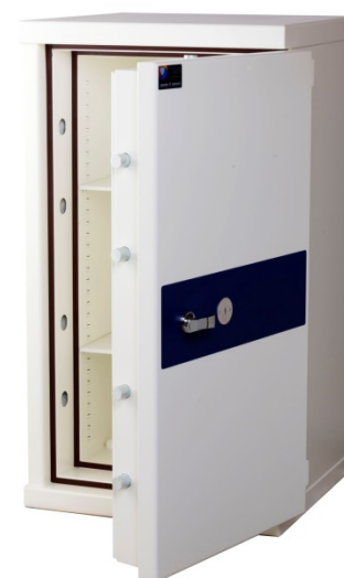
Euro H Plus 105

Vi anbefaler, at vi udfærdiger en installationserklæring til dig af hensyn til forsikringskrav og kvalitetssikring.