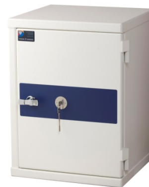
MiniRed H 060