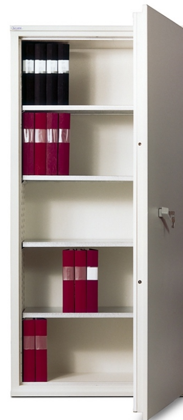
Dokumentskab FireSafe BDA 310