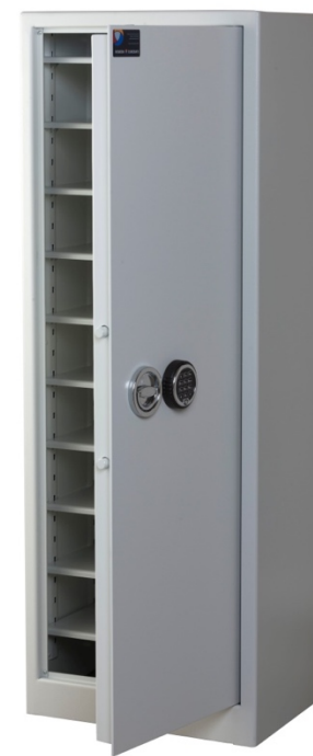
Sikringsskab SAK Maxi Spartan Pivot elektronisk kodelås