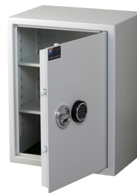
Sikringsskab SAK Spartan Pivot elektronisk kodelås