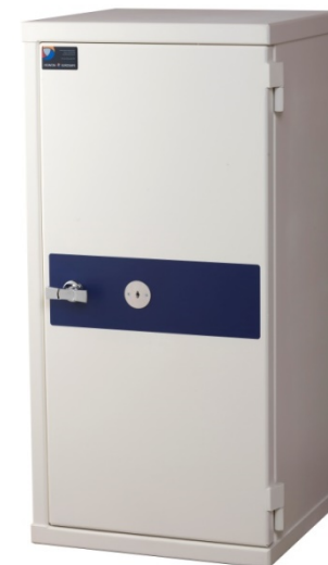
MiniRed H 100