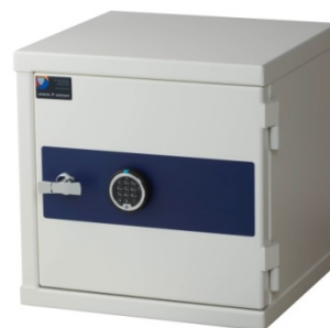
MiniRed H 040 Titan D-Drive elektronisk kodelås

De brandsikre pengeskabe leveres som standard tomme, da der stor efterspørgsel på specialindretning i pengeskabene. Derfor er der mange muligheder, eksempelvis hylder, boksrums, hængemappeudtræk og nøgletavler kan bestilles og integreres i skabene uden problemer. Vores serviceafdeling er altid behjælpelige med specialindretninger.