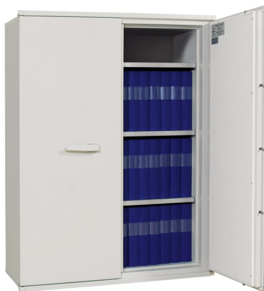
Dokumentskab FireSafe BDA 390

Indretningerne er nemme at sætte i skabene og kan naturligvis flyttes, hvis dette ønskes. FireSafe BDA 210 og BDA 310 har kun én dør som leveres højre hængslet som standard (kan også leveres venstre hængslet).