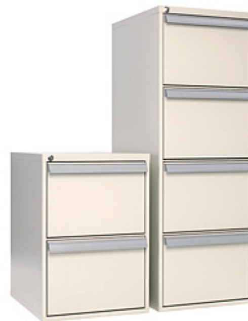
FireSafe Vertical 2 - 31/60 A4 FireSafe Vertical 4 - 31/60 A4

De brandsikre skuffer er forsynet med et antivippe sikkerhedssystem, således at man kun kan åbne én skuffe ad gangen. Herved undgår man også at komme til skade eksempelvis ved at klemme fingrene.