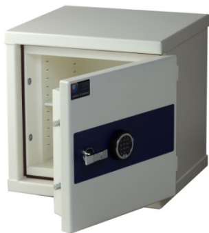
MiniRed H 040 Titan D-Drive elektronisk kodelås