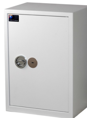
Sikringsskab SAK-E Medi Spartan Pivot elektronisk kodelås