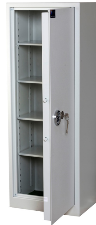
Sikringsskab SAK-E Maxi Spartan Pivot elektronisk kodelås