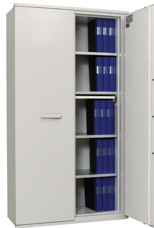
Dokumentskab FireSafe BDA 580