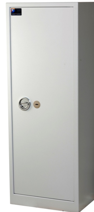
Sikringsskab SAK-E Maxi Spartan Pivot elektronisk kodelås