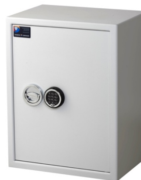
Sikringsskab SAK Medi Spartan Pivot elektronisk kodelås