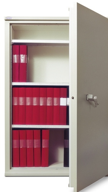
Dokumentskab FireSafe BDA 210