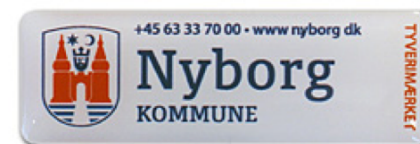
Det synlige ID Special tyverimærke