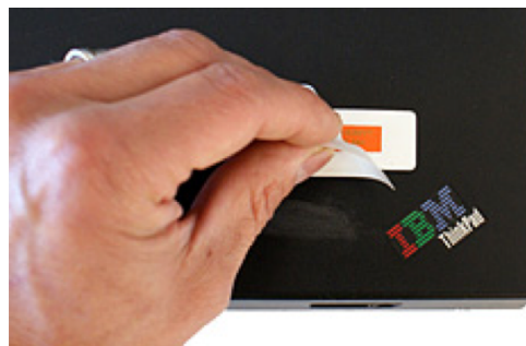
Det skjulte tyveriskilt på bagsiden