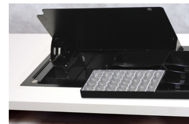
DeskSafe DK med udtagelig kassette