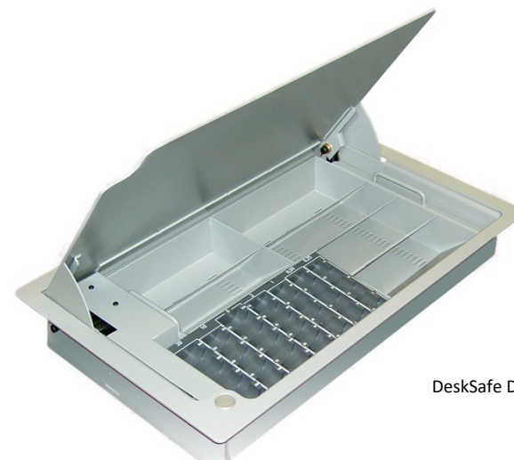
DeskSafe DK Standard