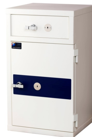
Deponeringsskab Euro HD 60 Nøglelås på deponeringsskuffe og dør

Euro HD findes i to sikringsniveauer, indenfor hvert niveau er der 3 og 4 forskellige størrelser. Herudover leveres skabene som standard tomme, men skabene kan leveres med hylder. Euro HD er fremstillet af de bedste materialer i et smart design. De er strukturlakerede i farven modehvid – RAL 9010.