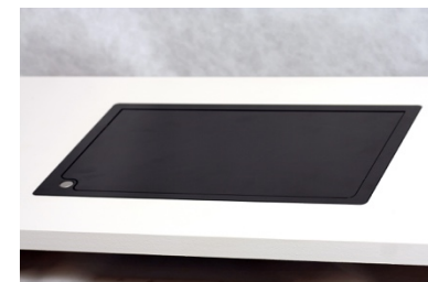
DeskSafe DK nedfældet i bordplade