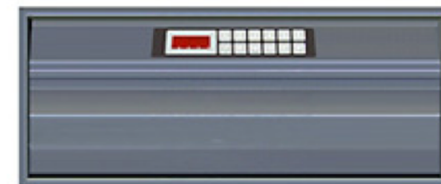
CashSafe T MultiSafe