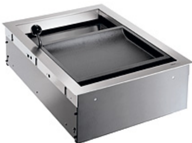
Betjeningssluse WI 20

Betjeningssluser WI anvendes indendørs til tryk og sikker udveksling af breve, kvitteringer samt penge og mindre pakker i receptioner, service- og kassefunktioner med flere.