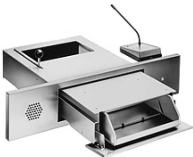
Betjeningssluse WF 51.01

Betjeningssluse klassificeret i FB7 med en skuffe der skydes ud i modsat retning af en lukket topplade. Automatisk aflåsning i begge slutpositioner. Skuffen kan skydes 228 mm ud og rumme emner op til 100 mm i højden WF 54.01 er udstyret med front facia og integreret samtaleanlæg (kan dog også bestilles uden facia og samtaleanlæg). Udført i børstet rustfrit stål og coatet sortbrun specialplast. Skuffe i sortbrun lakeret stål. Kan leveres brandsikker op til F90.