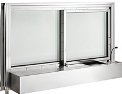
Betjeningssluse WE 7020

Består af en vinduessektion i børstet stål, en Betjeningssluse WI 20, en Betjeningssluse WM 105 samt integreret samtaleanlæg. De integrerede vinduesrammer og desk er i rustfrit eller lakeret stål. Det komplette element er klassificeret FB4 og glasset leveres i flere forskellige klassifikationer, men som standard BR 4. Kan leveres brandsikker op til F90. WE 7520 er beregnet for et murhul på 760 mm i bredden og 2000 mm i højden.