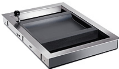
Betjeningssluse WI 30

Drejesluse til udveksling af billetter, penge, adgangskort, kvitteringer med mere. Når håndtaget udløses af personalet drejer tallerkenen automatisk 180 grader rundt, hvorefter den igen låses i positionen. Udført i 1,5 mm rustfrit stål og bakken i coatet sortbrun specialplast. Udvekslingshøjden er 30 mm og følger standarden i de vejledende normer for billetluger.