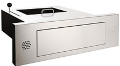
Betjeningssluse WF 54.01