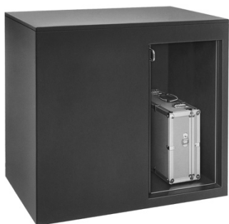
Kuffertsluse WM 100

Betjeningssslusen er klassificeret i FB4 og anvendes til udveksling af kufferter og lignende. De to døre betjenes manuelt – men styret af det automatiske interlocking system der sikrer, at kun én dør kan være åben af gangen. For at gøre udvekslingen så nem som mulig leveres slusen uden gulv. Betjeningssslusen er fremstillet af stål lakeret i RAL/NCS farve efter ønske. Indvendigt er den fremstillet af rustfrit stål. Kan leveres brandsikker op til F90. Se også målskema på model WM 106 FB4.