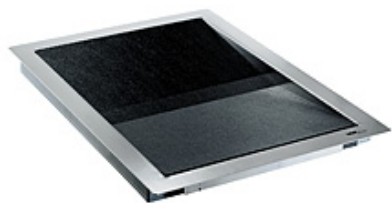
Betjeningssluse WI 10

Betjeningssluserne WI BASIC er en enkel og sikker løsning til indendørs brug. Sluserne anvendes til tryk og sikker udveksling af breve, kvitteringer samt penge og mindre pakker i receptioner, service- og kassefunktioner med flere.