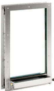
Betjeningssluse WE 7005

Element WE betjeningssluser er til montage i væg, og anvendes indendørs til tryk og sikker udveksling af breve, kvitteringer, penge og pakker, tasker og kufferter i receptioner, service- og kassefunktioner med flere.