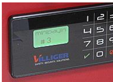
Dit brugernummer vises i display