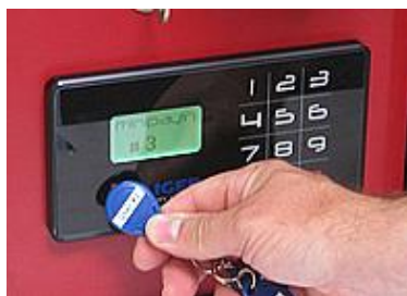
Identificer dig med kontaktnøglen

I den daglig brug for slutbrugere betjenes minipayIn direkte på touch panelet på fronten af døren. Man holder ganske enkelt kontaktnøglen ned til touch panelet hvorefter display og seddellæseren lyser grønt og man kan deponere sedlerne. Når deponeringen er afsluttet går systemet tilbage til udgangspunktet og en anden bruger kan deponere. Systemet udskriver automatisk en kvittering for de deponerede sedler.