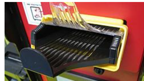
Bunch feeder med plads op til 30 sedler