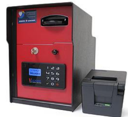
minipayIn 1 med Single Feeder og printer