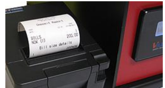
Udskrifter af alle transaktioner

Hvis seddellæseren skal renses, som følge af eksempelvis snavsede sedler, kan brugerne åbne servicedøren på minipayIn og tage seddellæseren ud og rense den. Det tager under 2 minutter og der vil ikke være adgang til pengene i kassetten.