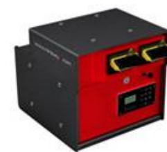
MinipayIn 1 SF