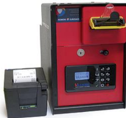
minipayIn 1 med Bunch feeder og printer