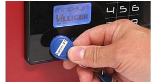
Enkelt og brugervenlig interface