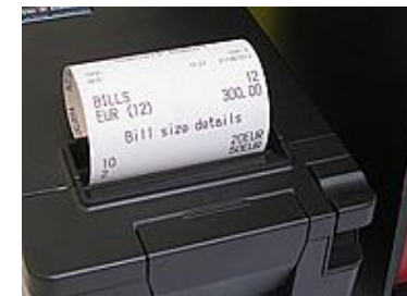
Der printes automatisk en kvittering