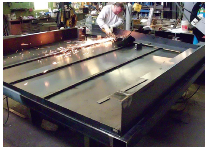
Produktion af den 'rustne kasse'.

Vi fik meget frie hænder fra start. På tegningerne vises skitser fra den første brainstorming til monterrummet ud fra projektgruppens tanker og idéer. Det endelige design vises nederst, og er lavet af Howeni Projects Security Advisors med anbefaling til materialer.