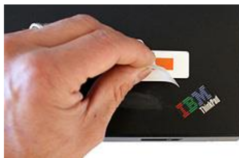
Det skjulte tyveriskilt på bagsiden