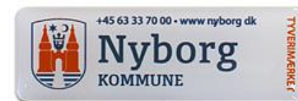
Det synlige ID Special tyverimærke